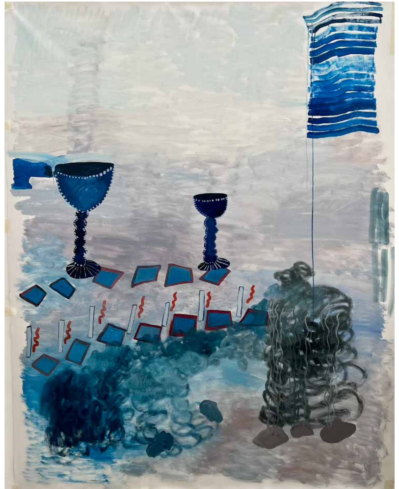
quema nocturna — 200x156cm óleo sobre tela 2022