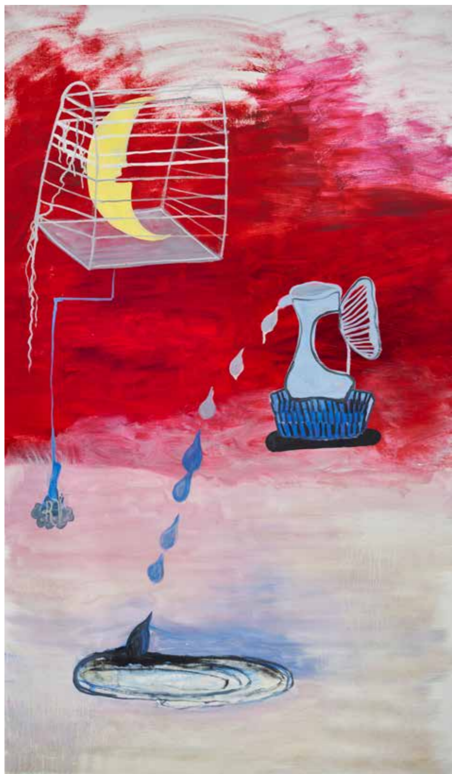
Remedios y yo — 151x94 cm óleo sobre tela 2022