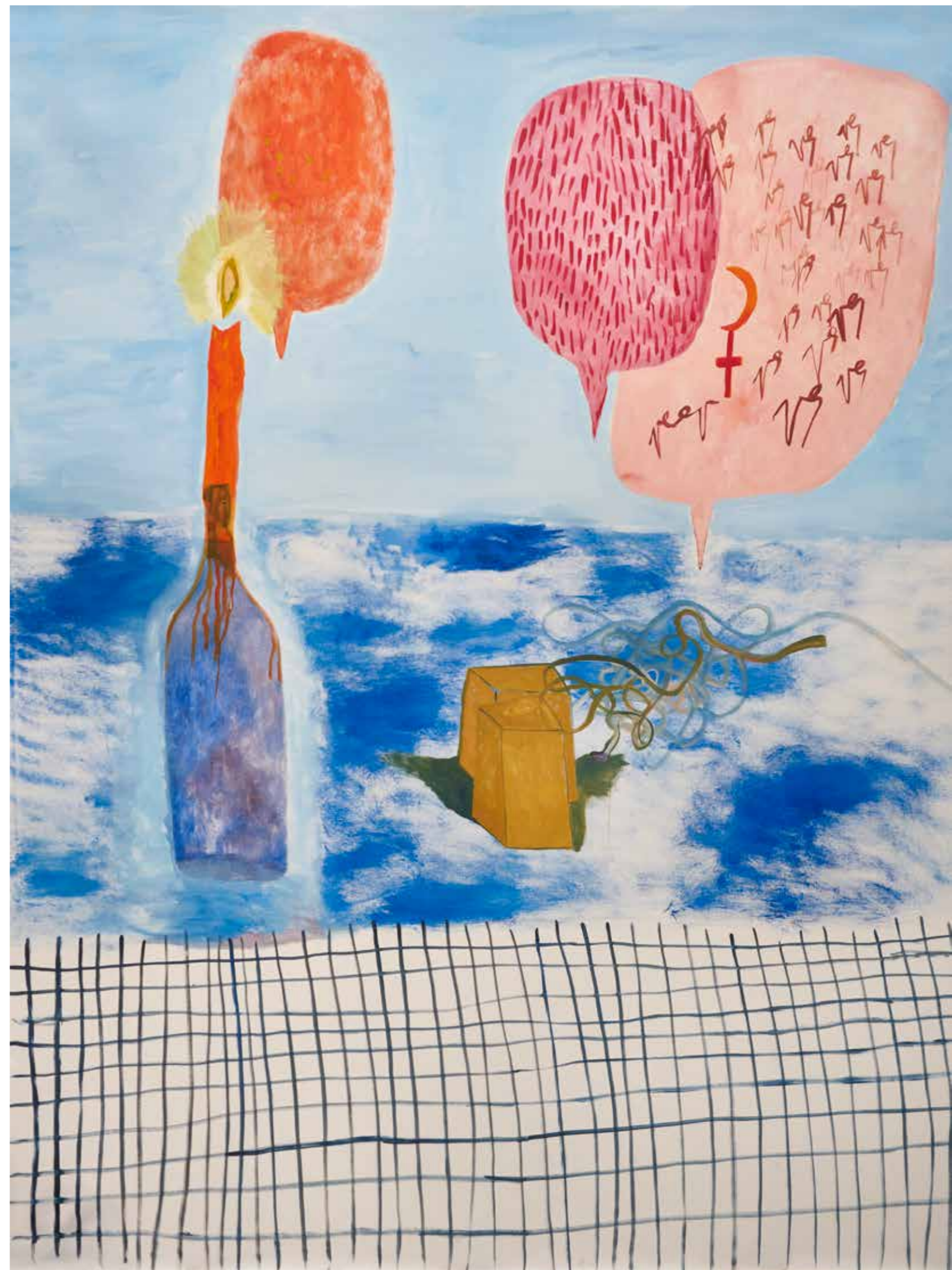
rutina sanadora — 200x156cm óleo sobre tela 2022