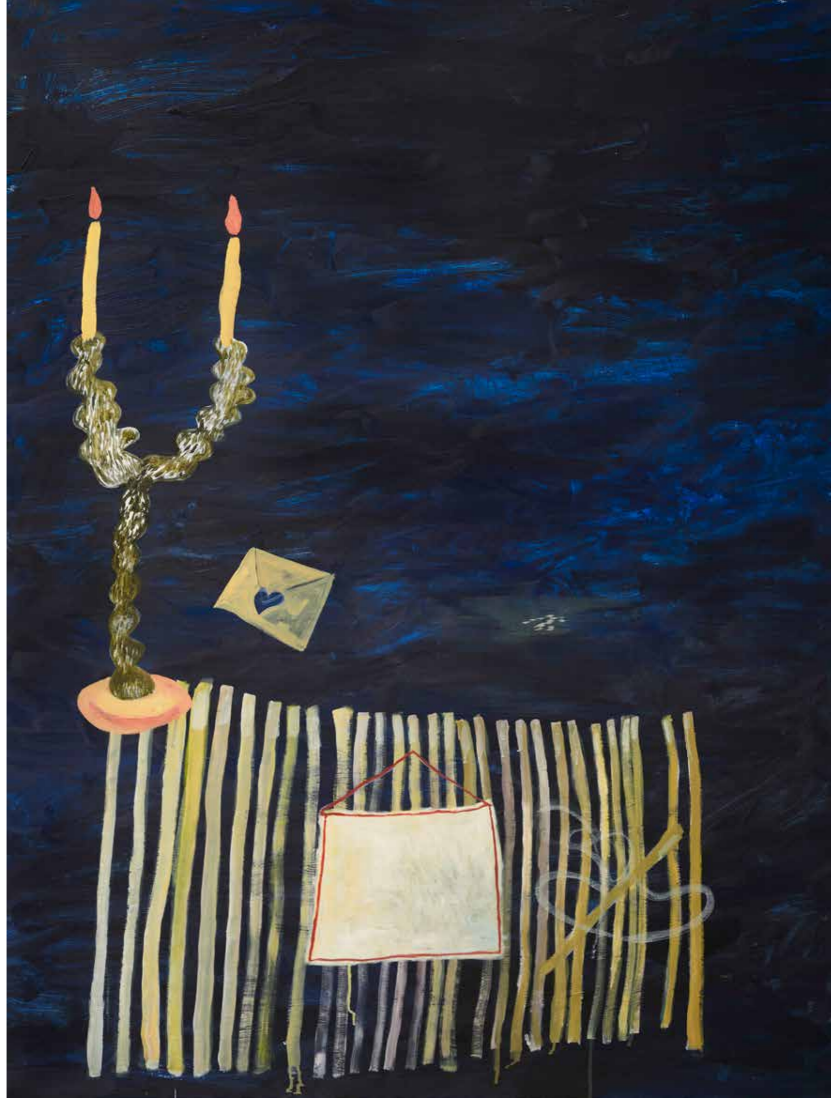
el mejor regalo — 200x 156 cm óleo sobre tela 2022