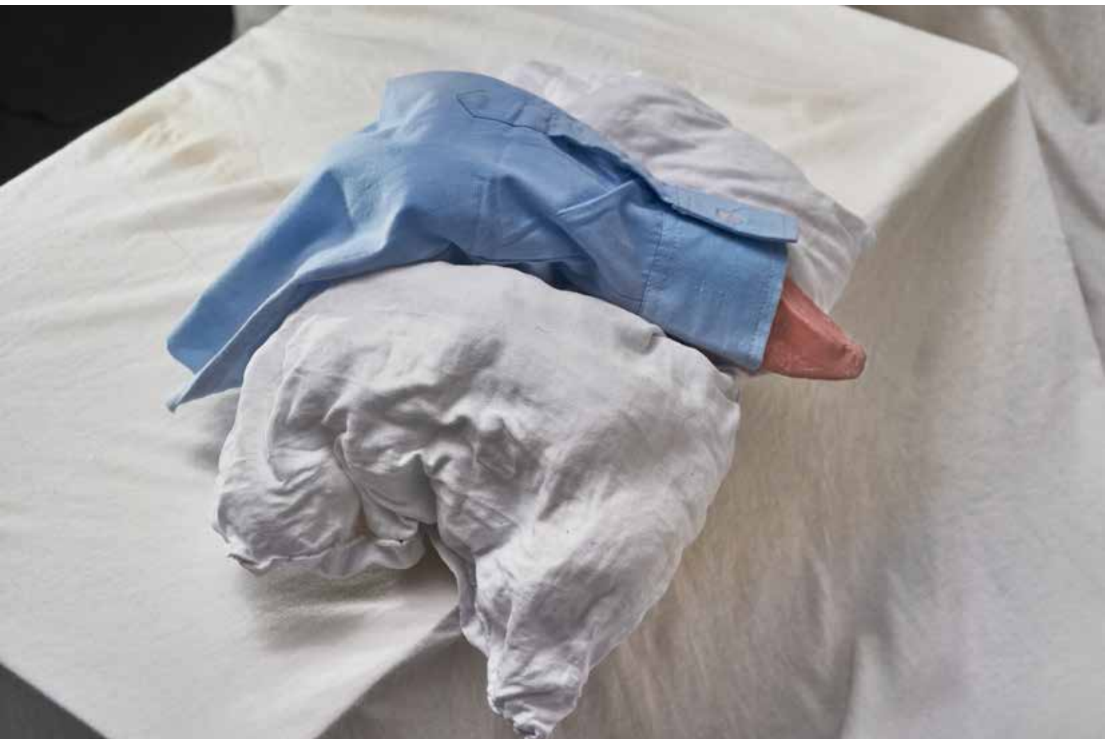
Perfume Peligro — Instalación [detalle] 6,28 x 3 m x 4,71 m 2021