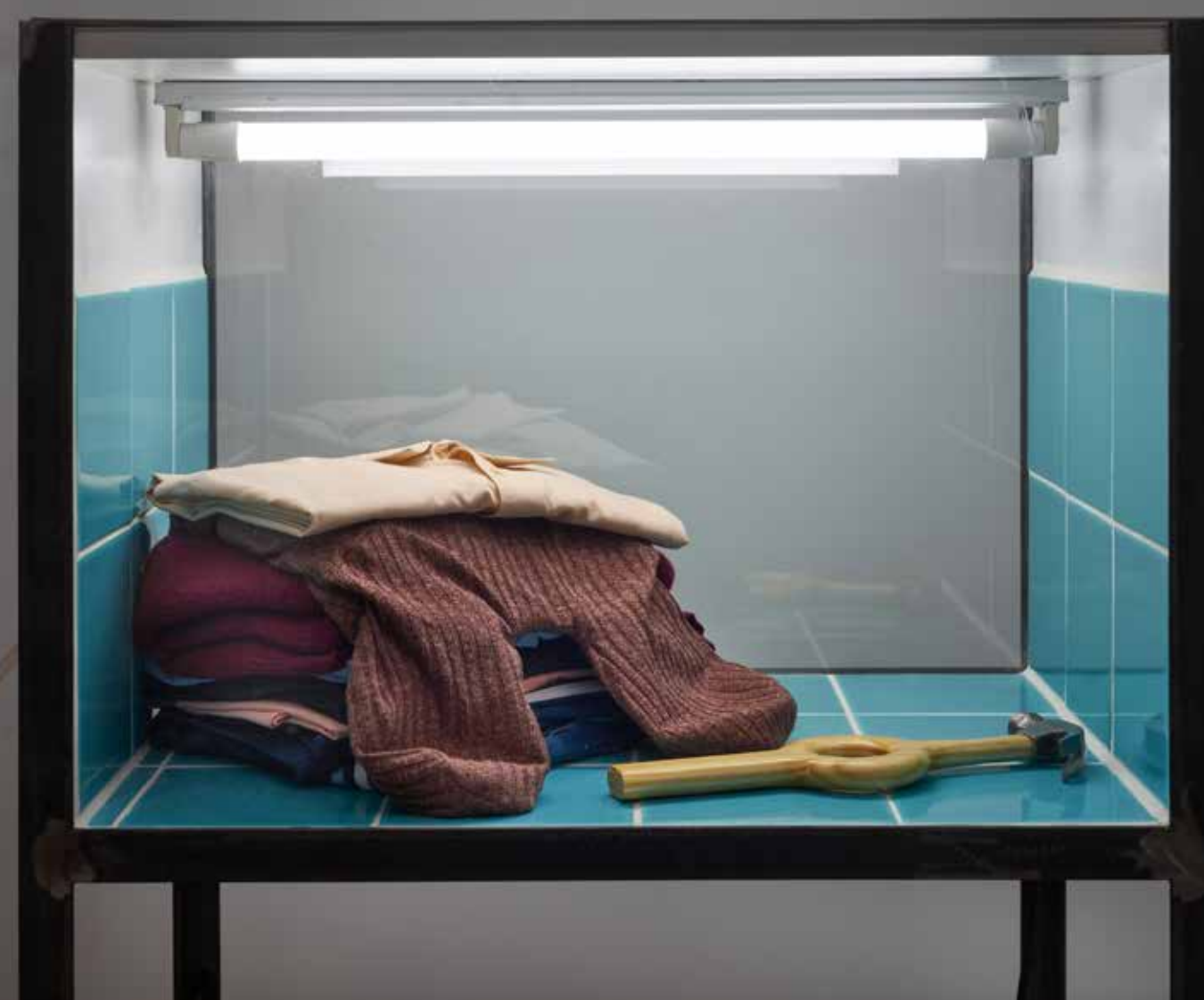
Intimididades sobre vapor

— Metal, vidrio, placa de melamina, malla mosquitera, yeso, latas, copa, plato de madera, migas de pan, moscas 160x70x50 cm 2021