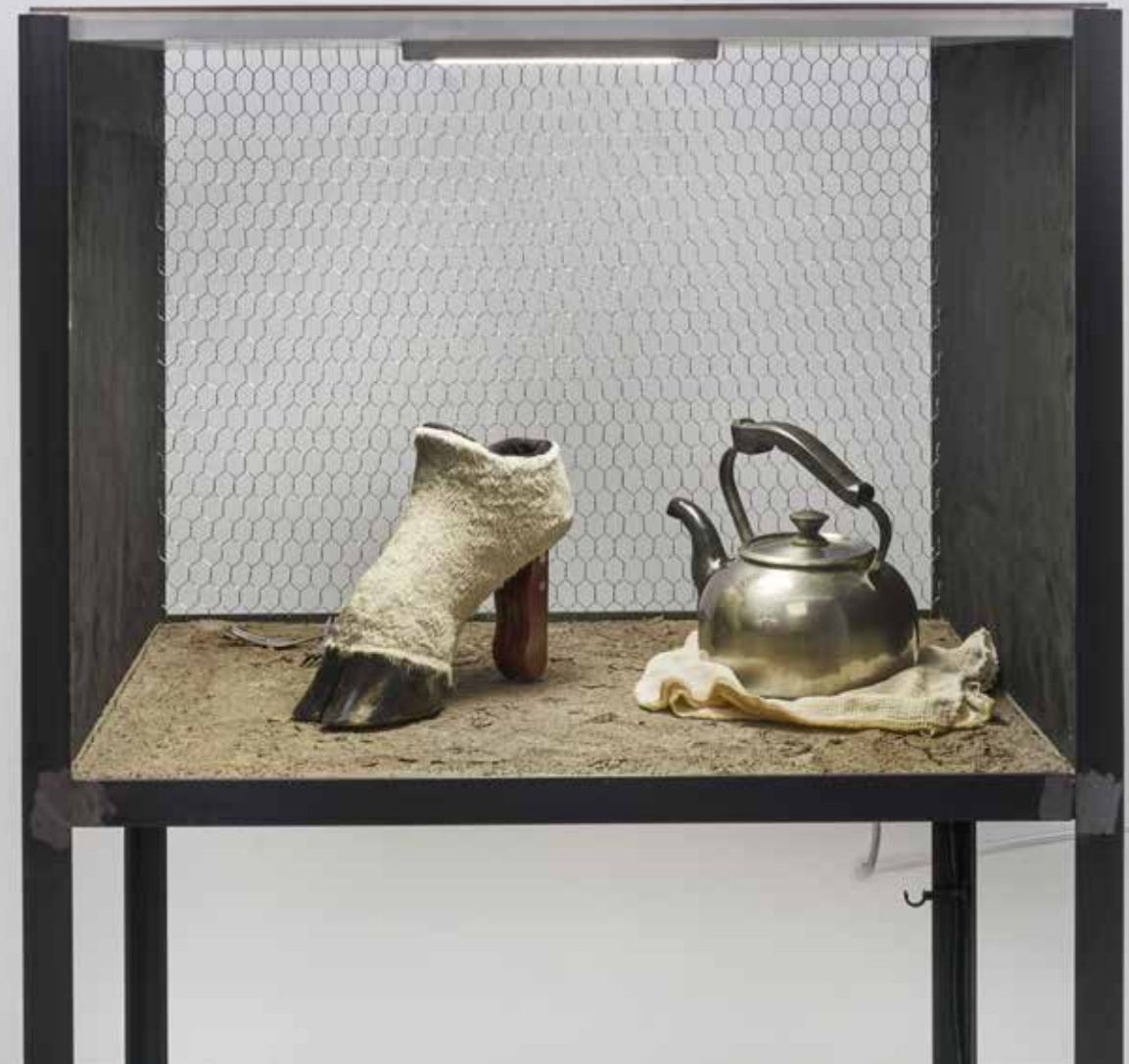
Las sombras húmedas

— Metal, vidrio, placa de melamina, nylon negro, carton, linterna, latas, espejos, y resina 160x70x50 cm 2021