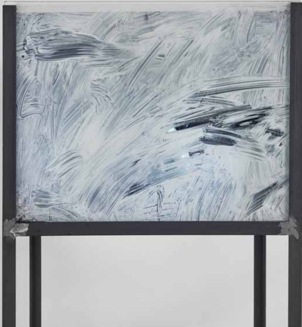
El aberno de las casas

— Metal, vidrio, placa de melamina, nylon negro, carton, linterna, latas, espejos, y resina 160x70x50 cm 2021